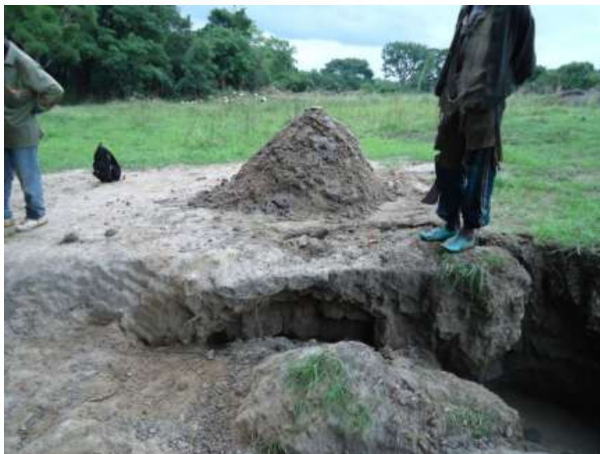
Mina artesanal a céu aberto em Mandiana Sul