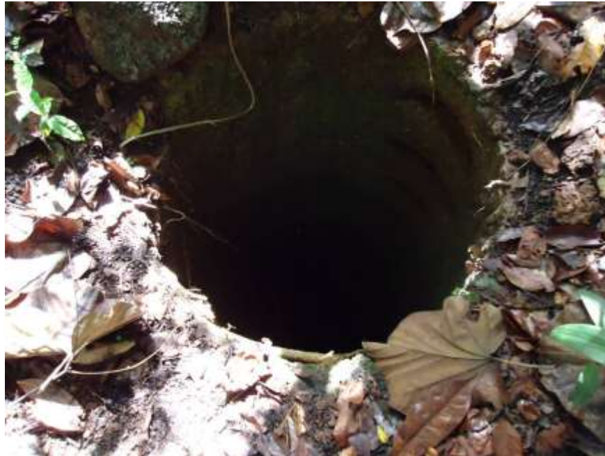
Furo artesanal profundo e estreito em Mandiana Norte